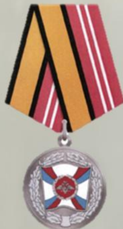
МЕДАЛЬ "ЗА УКРЕПЛЕНИЕ БОЕВОГО СОДРУЖЕСТВА"