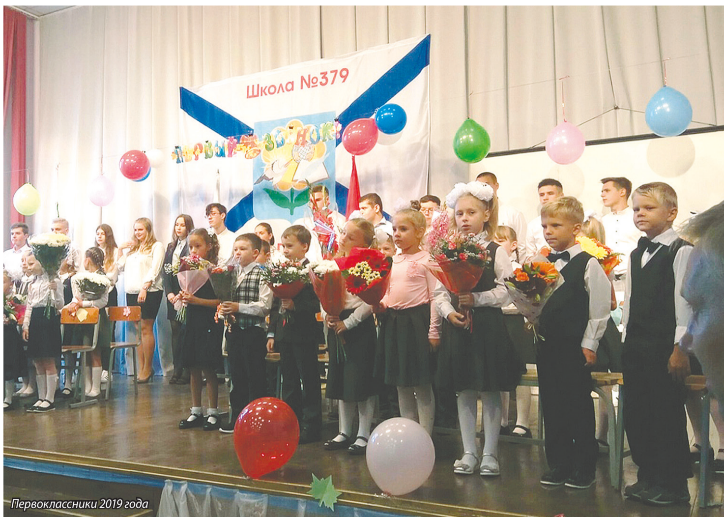
Первоклассники 2019 года

1 сентября в нашем округе за парты впервые сядут 32 первоклассника