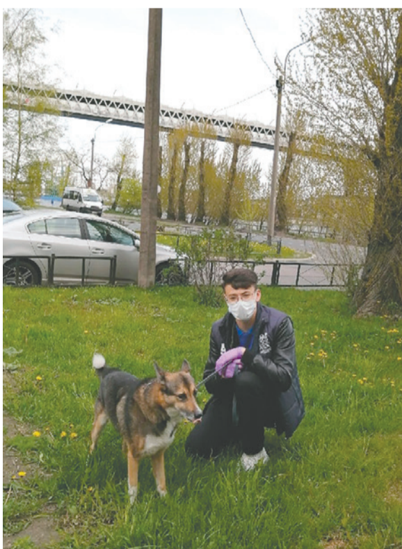
Волонтер выгуливает собаку жительницы Канонерки

– Желаю всем крепкого здоровья, успехов в работе и благополучия в семейных отношениях, – написала она.