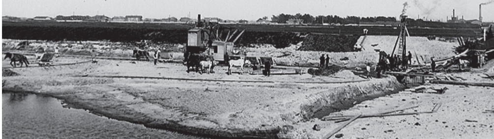
Так начинался Морской канал

Так Санкт-Петербург превратился в важнейший транспортный узел страны, связывающий морские и железнодорожные пути. В честь этого события была выпущена памятная медаль, а на выступе дамбы, отделяющей Гутуевский бассейн от Невы, установлен обелиск.