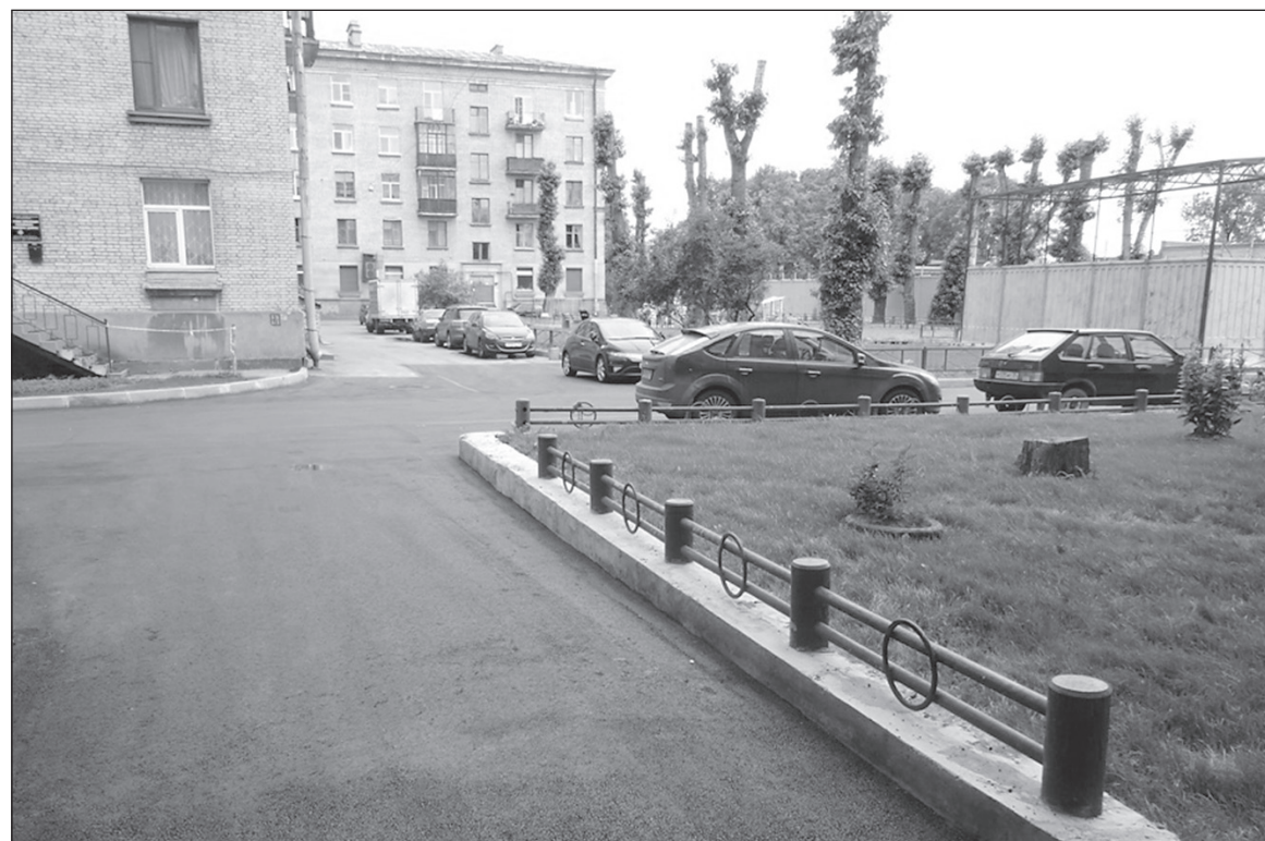
Благоустройство по адресу: улица Двинская, дома 9, 11.