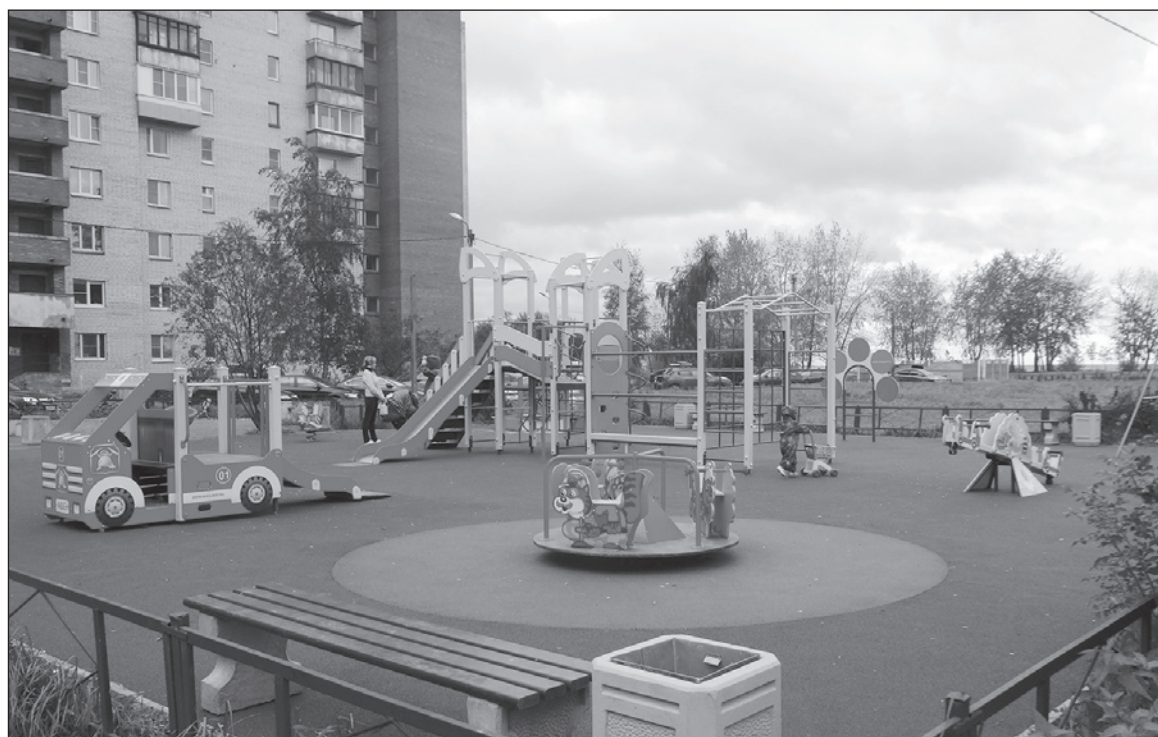
Детская площадка по адресу: Канонерский остров, между домами 7-8А.

Проблема плохих дорог актуальна для всей России и Канонерка не исключение. Кроме того, после приватизации Канонерского завода они вообще стали ничейными. Необходимо было срочно найти хозяина. По-