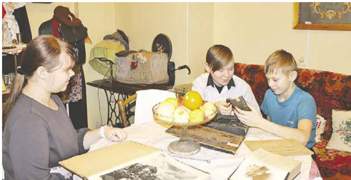
Хозяева в этом музее – дети. В нем все можно потрогать руками.

В музее, который в 2017 году был включен в реестр Федераль-