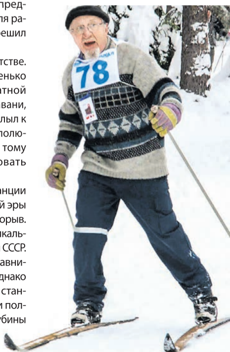
Наш герой полон сил и идей