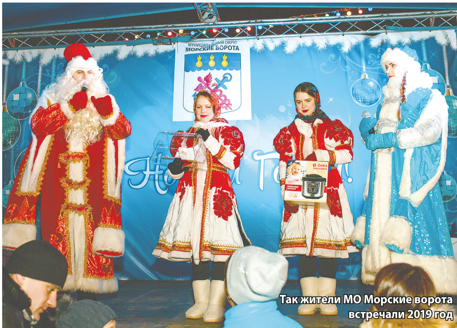
Так жители МО Морские ворота встречали 2019 год

Совсем скоро на календаре сменится дата – наступит 1 января 2020 года. Кабан, сопровождающий нас в 2019 году, уступит место Крысе. Каким он будет, этот наступающий год Белой Металлической Крысы? Будет ли она благосклонной или проявит свои худшие качества? Какие радости и печали, победы и поражения она принесет? Кому Крыса задаст жару, а кому выдаст счастливый лотерейный билетик?