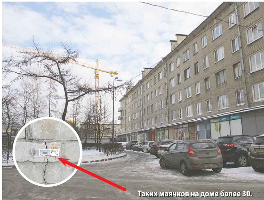
Таких маячков на доме более 30.

По адресу: ул. Двинская, д. 8, корп. 3, завершается строительство жилого комплекса комфорт-класса «Панорамы залива» на 347 квартир, общей площадью 21,9 тыс. кв. м, со встроенно-пристроенными помещениями и с подземным паркингом на 149 мест. Планируемый срок окончания строительства – 2021 год.