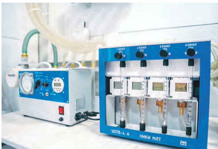
Новое оборудование автоматической станции мониторинга