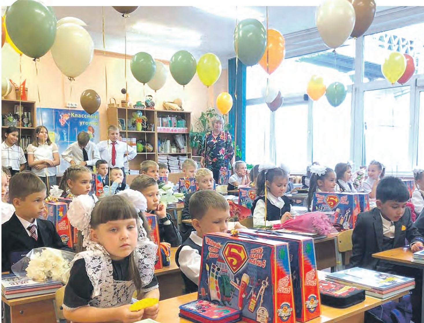
Первоклассники школы № 379 2022 года

В этом году 1 сентября в нашем округе первоклассниками школы № 379 станут 30 ребят. Учение — одна из величайших потребностей человека. Учитесь, обогащайте знаниями себя, нашу страну! Современный мир меняется слишком быстро и требует постоянного обновления знаний, поэтому помните: человек, который перестает учиться, отстает от жизни.