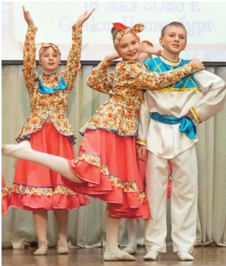
На сцене «Ой, как ты мне нравишься!»

Мальчик признается, что совмещать учебу и частые репетиции непросто, но интересно. Андрей ведь еще и круглый от-