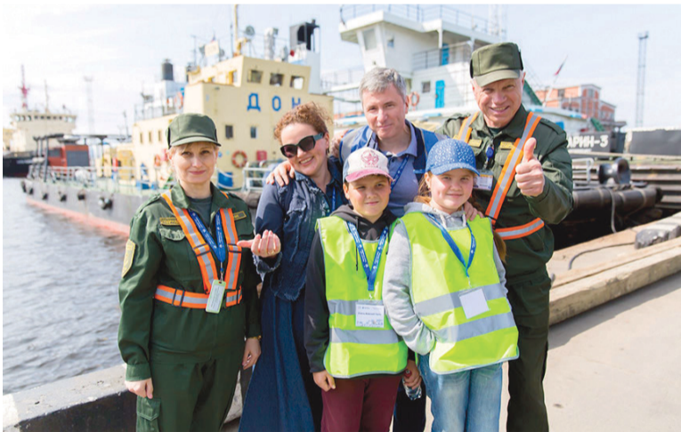
«Важным гостям» в порту рады

Дирекция организовала автобусную экскурсию по территории порта. Детям