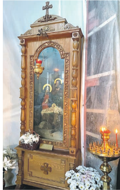
Обновившаяся икона Рождества Христова

Во время блокады Ленинграда здесь был морг. Однажды в крышу по-