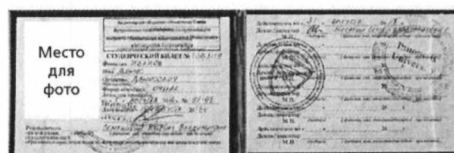
при оформлении абонементных билетов и разовых билетов в терминалах самообслуживания

Для оформления в терминалах самообслуживания разового проездного документа (билета) необходим электронный носитель, при контроле проезда в поездах пригородного сообщения предъявляется студенческий билет (с фотографией) и электронный носитель