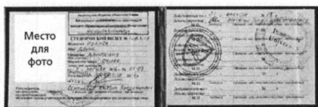
при оформлении в билетных кассах и пригородных поездах

Для оформления абонементного билета дополнительно предоставляется именной электронный носитель «Карта учащегося».